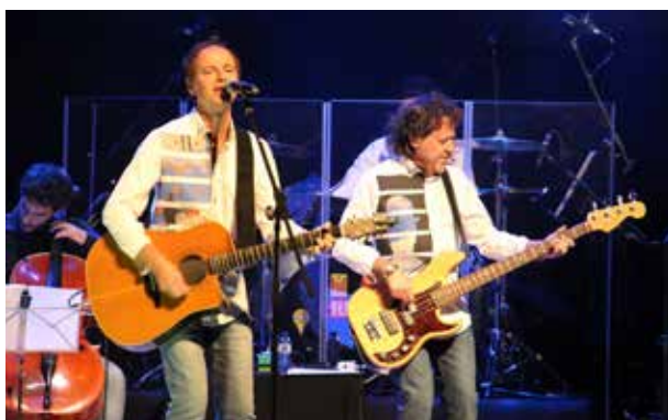
Els Pets al Festival Narciso Yepes Ordino i Fundació Crèdit Andorrà.