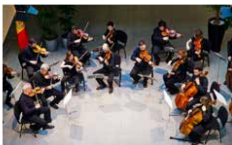
Concert El classicisme simfònic al vestíbul del Consell General.

La Fundació Orquestra Nacional Clàssica d'Andorra, formada pel Govern d'Andorra i per la Fundació Crèdit Andorrà, ha desenvolupat diferents programes, tant a Andorra com a l'estranger, per donar la difusió necessària i promoure l'activitat creativa de les formacions integrades en l'ONCA, així com per aprofundir en els programes educatiu, formatiu i social de l'entitat.