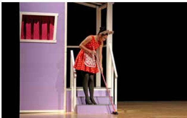
La rateta que escombrava l'escaleta.