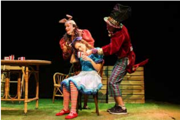
Representació d'Alicia meravellosa.