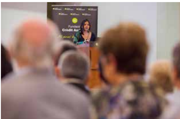
Conferència sobre l'alimentació per prevenir el càncer de la Dra. Odile Fernández.