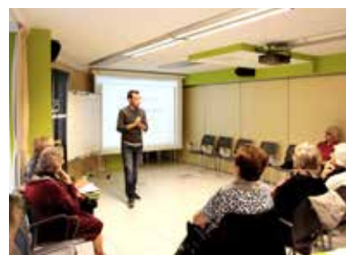
Assistents a una de les xerrades organitzades a L'espai.