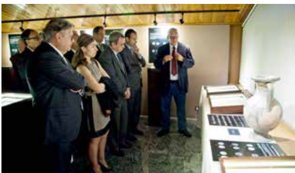
Inauguració de l'exposició "Monedes gregues i romanes: valor i missatge".

La col·laboració entre la Fundació Crèdit Andorrà i la Fundació Abadia de Montserrat 2025 va permetre presentar al públic del país l'exposició "Monedes gregues i romanes: valor i missatge". En aquesta mostra organitzada als locals del Fons d'Art de Crèdit Andorrà –formada per una selecció de més de 200 monedes procedents del Fons de Montserrat, que abasten des del segle IV aC fins al segle V dC–, el visitant va poder conèixer l'origen, l'evolució i els diversos sentits que té la moneda en l'antiguitat; aprendre com i per què apareix la moneda, i entendre la realitat social, política i econòmica de l'època.