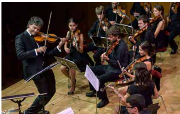
Concert de Meritxell.