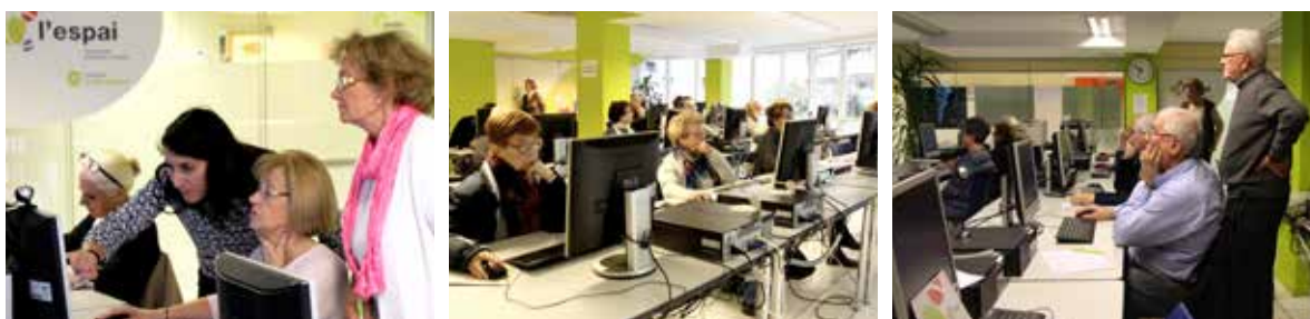
Alumnes als cursos d'informàtica que es duen a terme a L'Espai.

La posada a disposició d'un lloc de trobada i d'intercanvi entre les persones del grup, en el qual es proposen activitats per adquirir nous coneixements en temes ben diversos, és essencial. Al centre L'espai es concentra una gran part de les activitats de la Fundació, en unes condicions ideals per a qualsevol tipus d'iniciativa i amb unes instal·lacions adients per acollir un nombre creixent de propostes, suficient per donar resposta a una demanda cada vegada més gran.