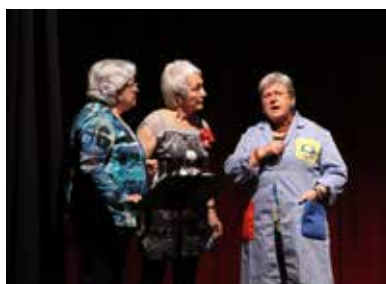
Representació teatral a càrrec d'usuaris de L'espai.