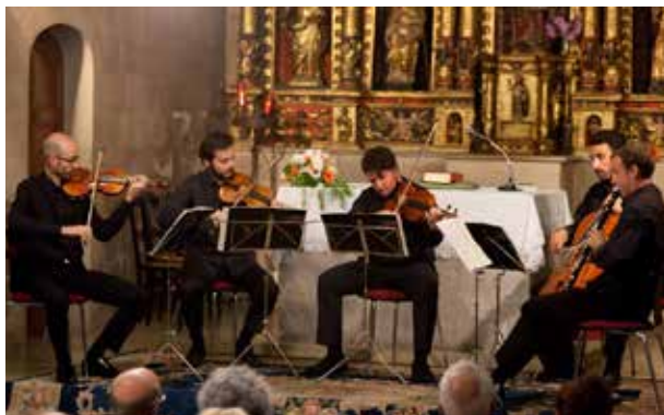
Concert d'Els intèrprets de casa a l'església parroquial d'Ordino.