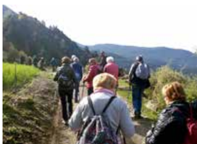
Ruta de senderisme a Certers amb usuaris de L'espai.