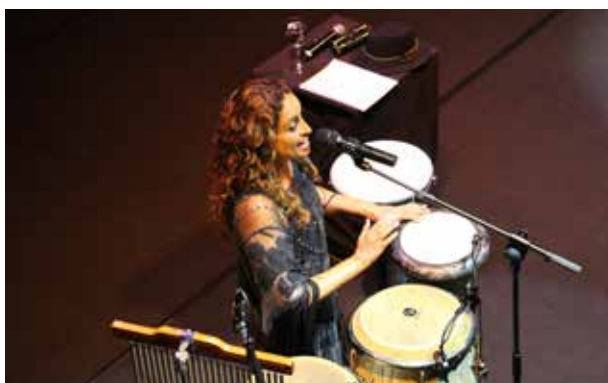
Actuació de Noa al Festival Narciso Yepes Ordino i Fundació Crèdit Andorrà.