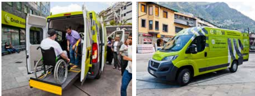
Vehicle adaptat lliurat per la Fundació Crèdit Andorrà a l'Escola Especialitzada Nostra Senyora de Meritxell.

Amb la voluntat d'afavorir la integració social i laboral dels usuaris de l'Escola Especialitzada Nostra Senyora de Meritxell, la Fundació ha lliurat a aquesta entitat un nou vehicle adaptat, que ha de contribuir a la millora de les particulars condicions de desplaçament que requereixen les persones usuàries del centre formatiu.