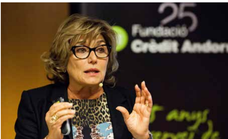
Conferència sobre l'alimentació per prevenir el càncer de la Dra. Odile Fernández.