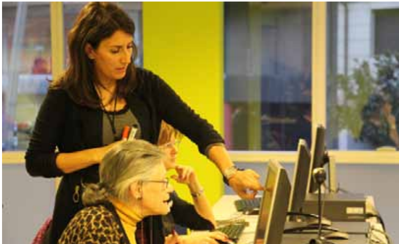
Cursos d'informàtica a L'espai