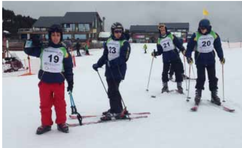
Participants d'Special Olympics en una prova a Soldeu-el Tarter