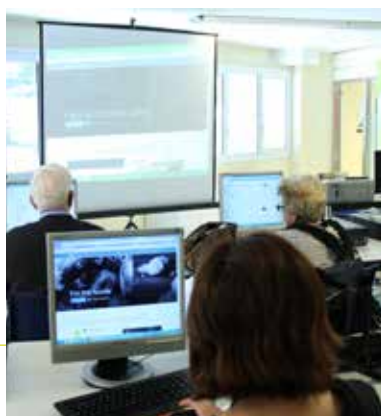
Creación de blogs.