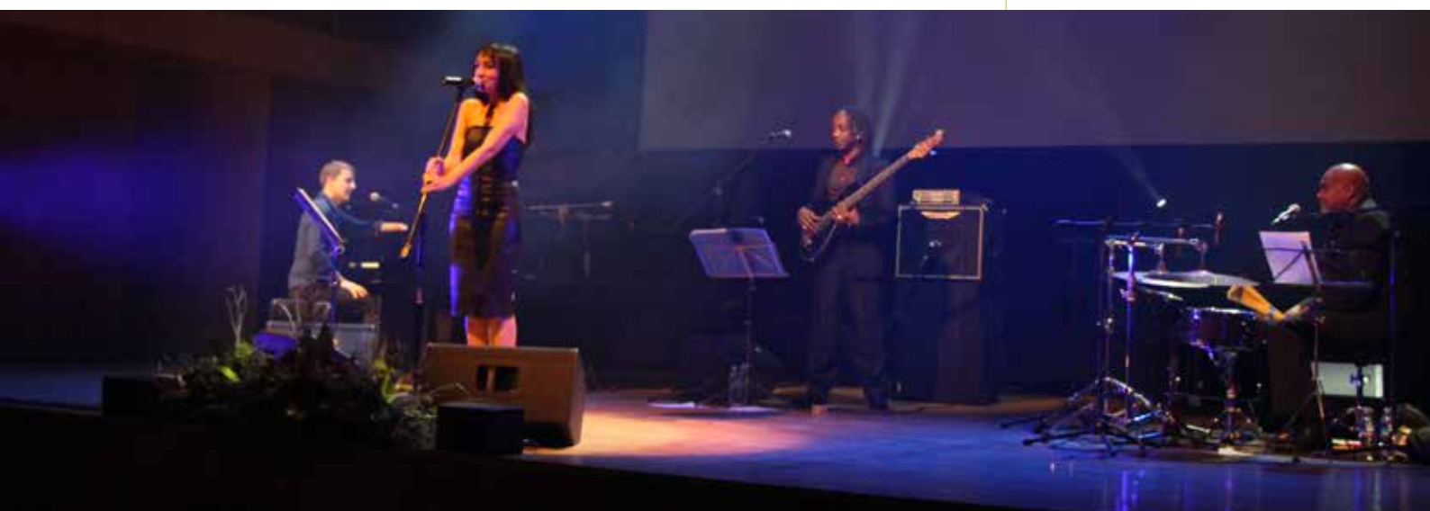
Maria de Medeiros.